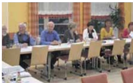
Sanierungskommission in Aktion

Es wird über alle notwendigen Maßnahmen in der Sozialen Stadt beraten und es werden die Beschlussempfehlungen für die nachfolgenden Ausschüsse der Stadt Leer (Sozialausschuss, Verwaltungsausschuss und Rat) formuliert.