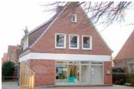
Sanierungsbüro, Hoheellernweg 37

beteiligten Ämtern der Stadt auch die GFS – Gesellschaft für Stadtsanierung GmbH – in ihrer Funktion als Sanierungstreuhänderin der Stadt Leer sowie die re.urban in ihrer Funktion als Sanierungsbeauftragte vertreten sind.