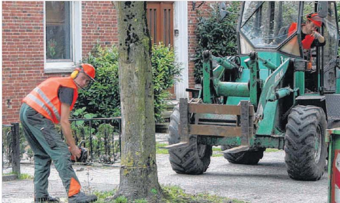
In der Annenstraße zwischen der Großen Roßbergstraße und der Augustenstraße hat die Firma Reno Hinrichs aus Westoverledingen mit der Abholz-Aktion begonnen.

Wie wir berichteten, hatte sich der Runde Tisch, das Bürgerforum der „Sozialen Stadt“, mit Mehrheit dafür ausgesprochen, alle Bäume abzuholzen und neue zu pflanzen. Dagegen schlug die Stadtverwaltung vor, dem Gutachten der Landschaftsgärtnerei Lindschulte aus Nordhorn zu folgen. Dem-