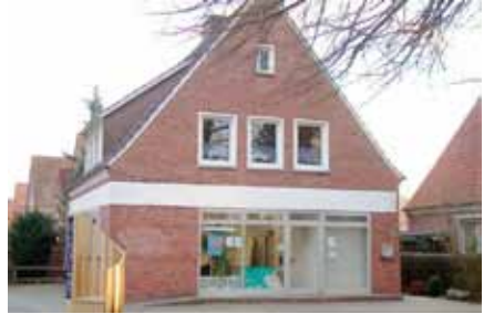
Sanierungsbüro, Hoheellernweg 37

beteiligten Ämtern der Stadt auch die GFS – Gesellschaft für Stadtsanierung GmbH – in ihrer Funktion als Sanierungstreuhänderin der Stadt Leer sowie die re.urban in ihrer Funktion als Sanierungsbeauftragte vertreten sind.