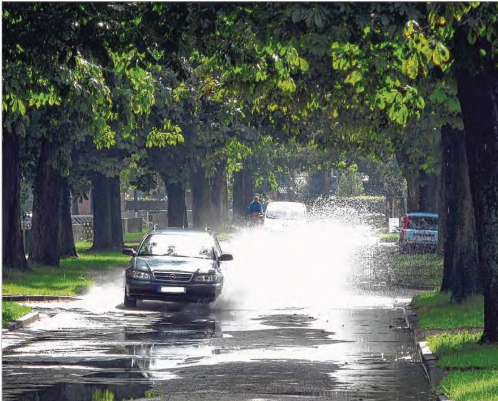
Seenlandschaft: Wenn es stark regnet, bilden sich große Pfützen auf dem Osseweg.

Im Januar dieses Jahres hat die Stadt die Mitteilung erhalten, dass der Ausbau des Osseweges in das Jahresbauprogramm des Bundes aufgenommen worden ist. Dies bedeutet,